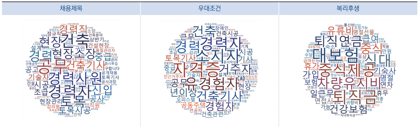
〈표15〉 건설기술인 채용 공고문 분석